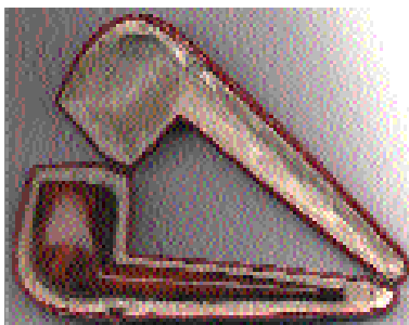
Pipe Dunhill. 1933 - Root Billard Group 4 : 2 500 $.

C'est connu : toute langue est le reflet d'une culture et d'une mentalité. Les Français l'appellent une pipe d'occasion. Une pipe d'occasion, messieurs, dames! Qui en voudrait? Dans l'imaginaire français, ce vocable souffre d'une connotation on ne peut plus négative. Il est automatiquement associé à des images peu appétissantes : vieilles bouf-