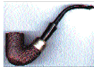
Peterson classic blasted medium sized Oompall with sterling ferrel & system stem : 65 $.

Qu'est-ce qui pousse tant d'amateurs et de collectionneurs à suivre assidûment le marché