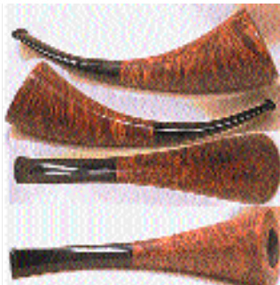
Tsuge : 330 $.

Tout d'abord, tout passionné de pipes rêve de trouver un jour une superbe bouffarde d'un pipier mythique à un prix dérisoire. Or, avez-vous déjà effectivement trouvé des pipes neuves dans le commerce traditionnel à des prix ridicules? À des prix invraisemblables? Je parie que non. En revanche, pour celui qui suit avec assiduité le marché de l'estate pipe, ces trouvailles inoubliables ne sont peut-être pas légion, mais elles ne sont pas vraiment rares non plus.