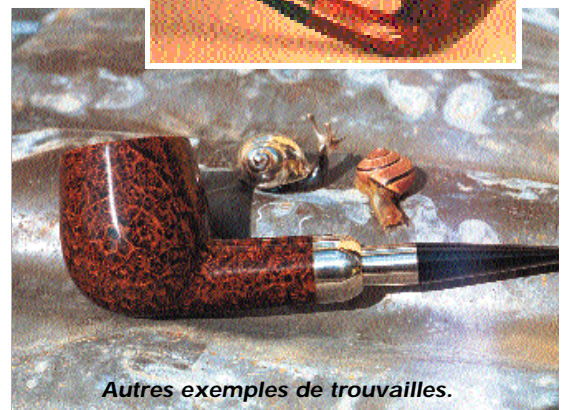
Autres exemples de trouvailles.